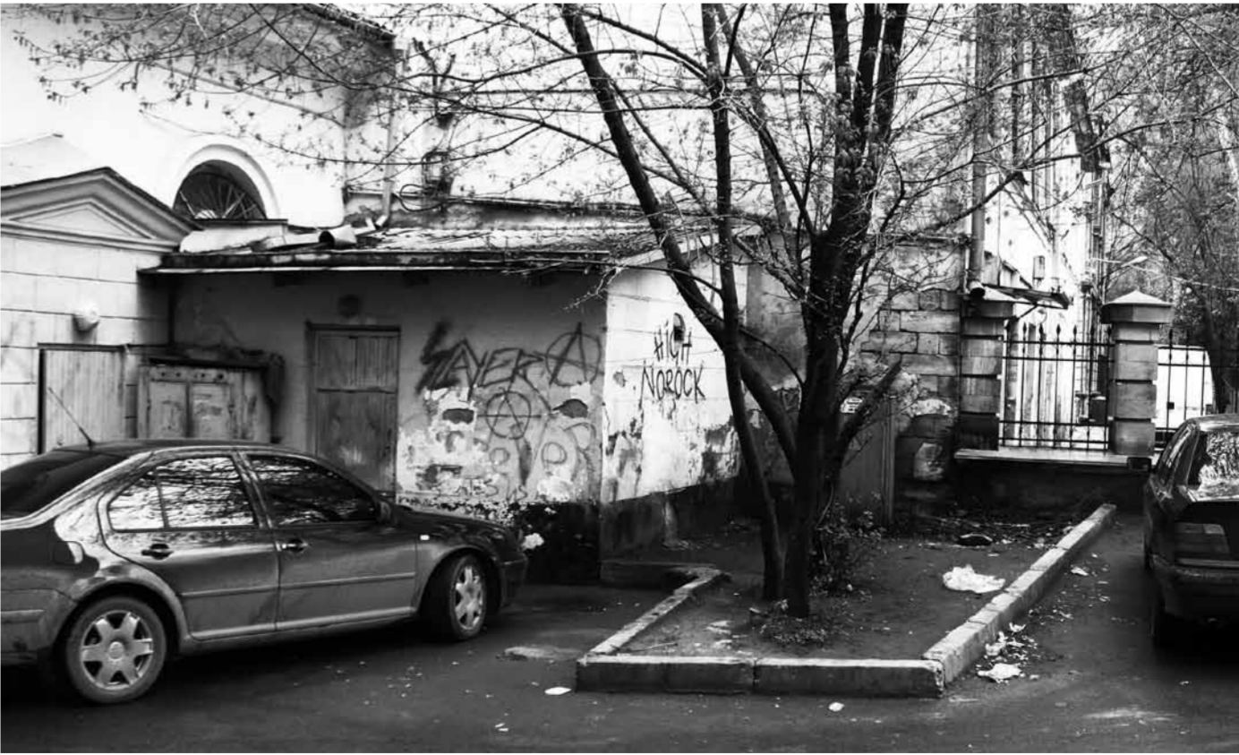
Fostul magazin de attribute rock, Chișinău, 2009, foto: Vladimir US

text: Vadim ȚIGANAȘ translation: Cristina ISPAS