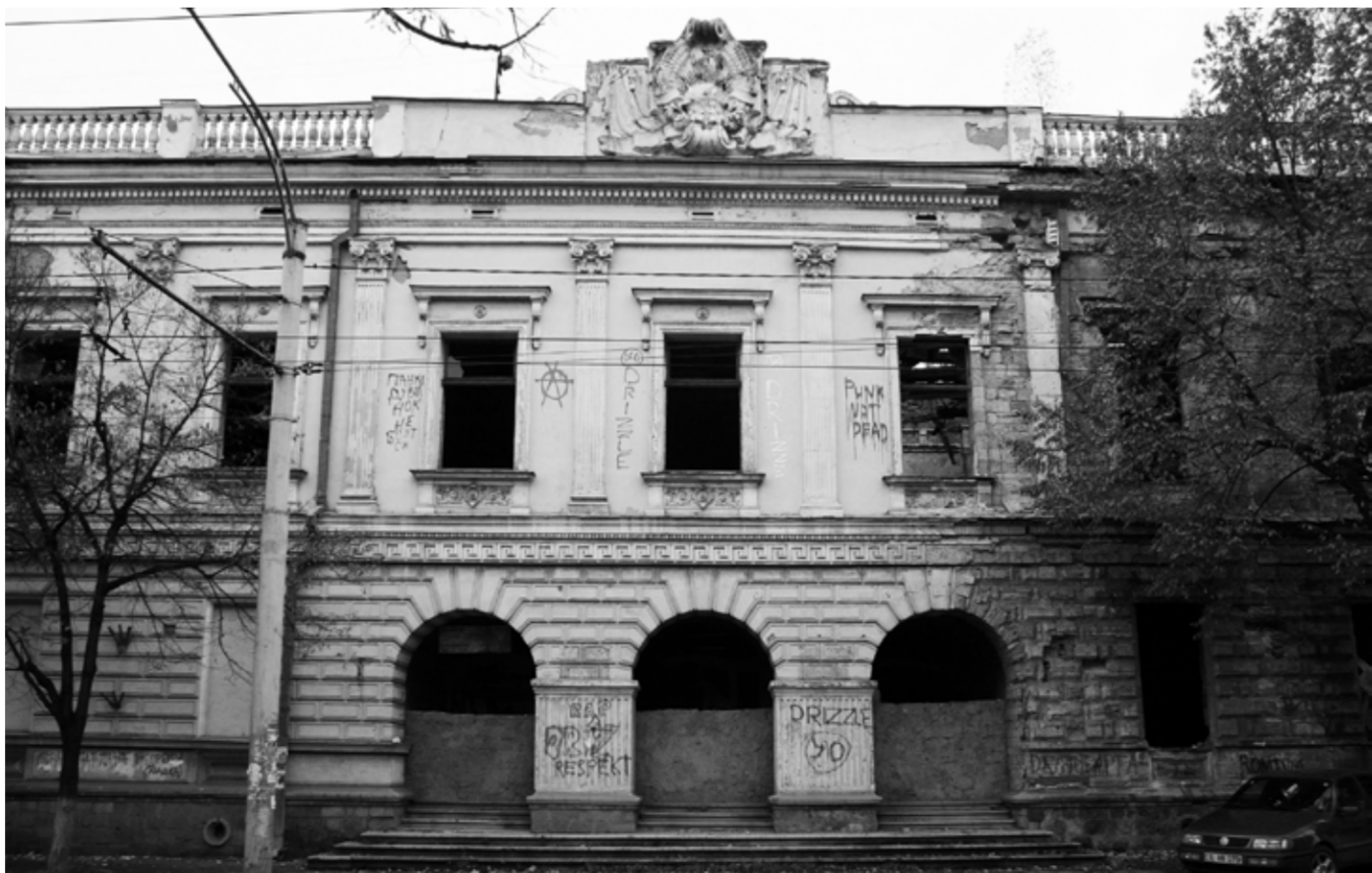
Conacul urban RIȘcanu-Derojînschi, Chișinău, 2008, foto: Vladimir US

Dață vorbim de inițiativele ce țin de o cultură alternativă în Chișinău, se pare că istoria se cam repetă periodic. După ce era Cuibul/Black Elephant a apus, se crea o imagine care dădea parcă de înțeles că tendințele și în general situația subculturilor au luat un alt aspect, o altă formă sau poziție. Acel stup în care se agita și fierbea o voce care se părea că vrea să înnebunească străzile mai tare decăt o fac vuvuzelele din Africa de Sud s-a perimat, și tinerii din Chișinău au început la un moment dat să fie foarte colorați, cuminiți, și total resemnați față de ideea vreunei rezistențe în fața unui așa-numit mainstream cultural. În ultima vreme însă se tot aude mai mult și mai mult vorbindu-se de underground – diferite inițiative, evenimente, practici, noi localuri care ni se recomandă cu acea remarcă „asta e underground”, deci e true și merită atenție, astfel că am putea să ne întrebăm dacă underground pentru Chișinău înseamnă ceva tendințe culturale vii\independente, camuflare a pieței retardate a produselor artistice, sau un brand utilizat pentru adjudecarea