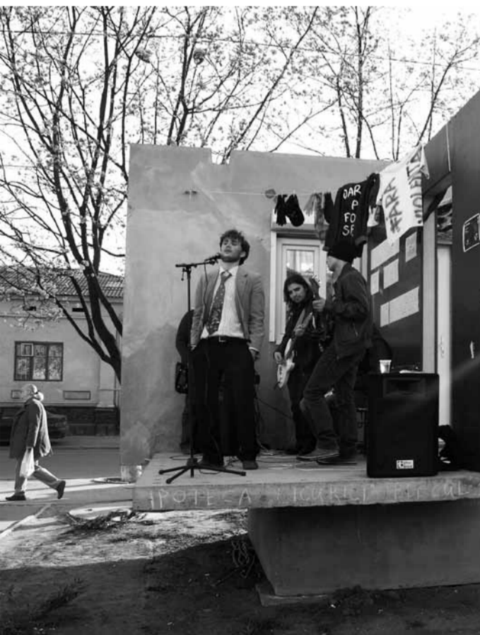
Formația No Shagga la APARTAMENT DESCHIS, Chișinău, 2010

>>> continuare pe: http://plic.oberliht.com