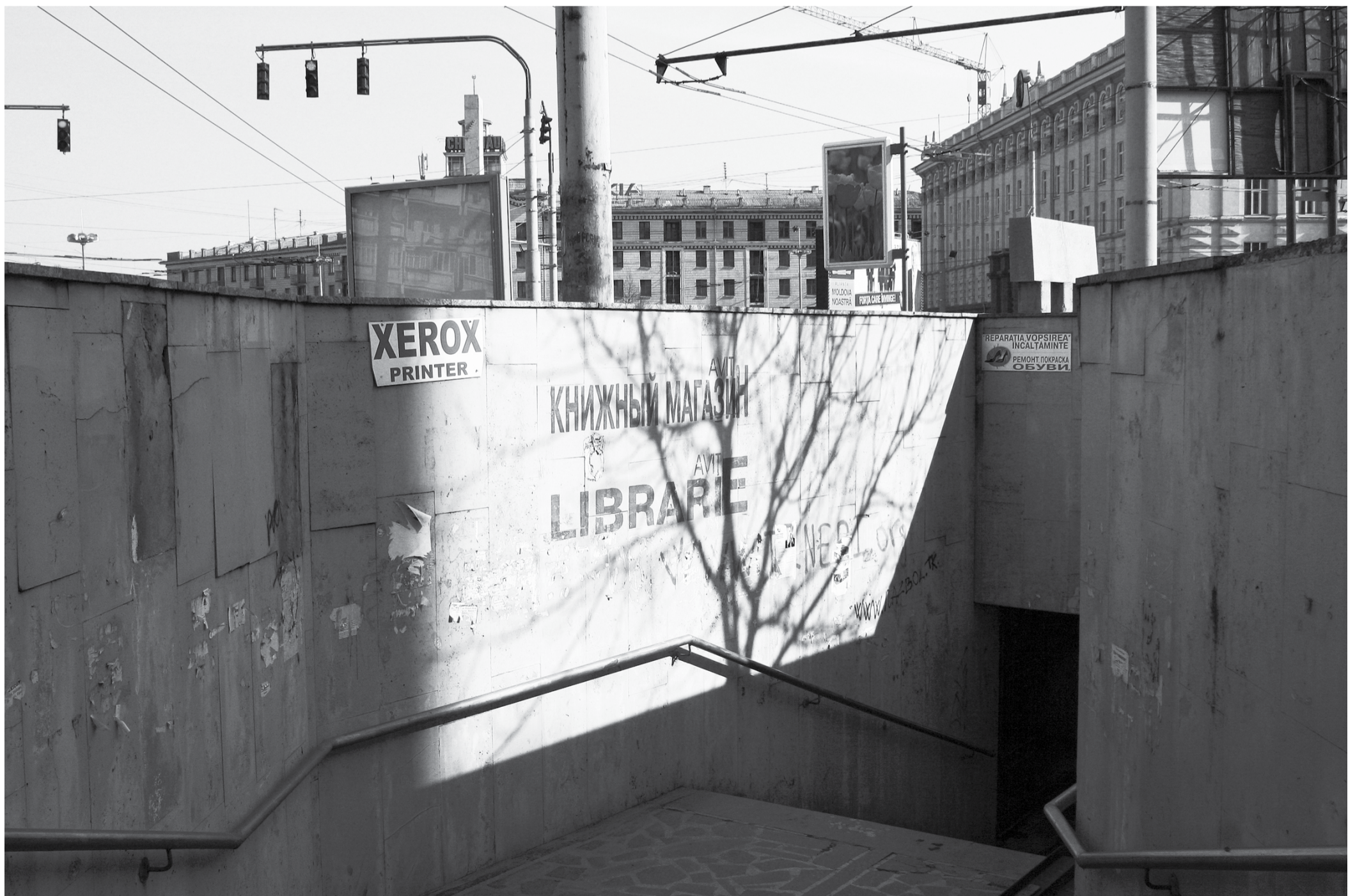
Intrarea în subterană, Chișinău, 2009