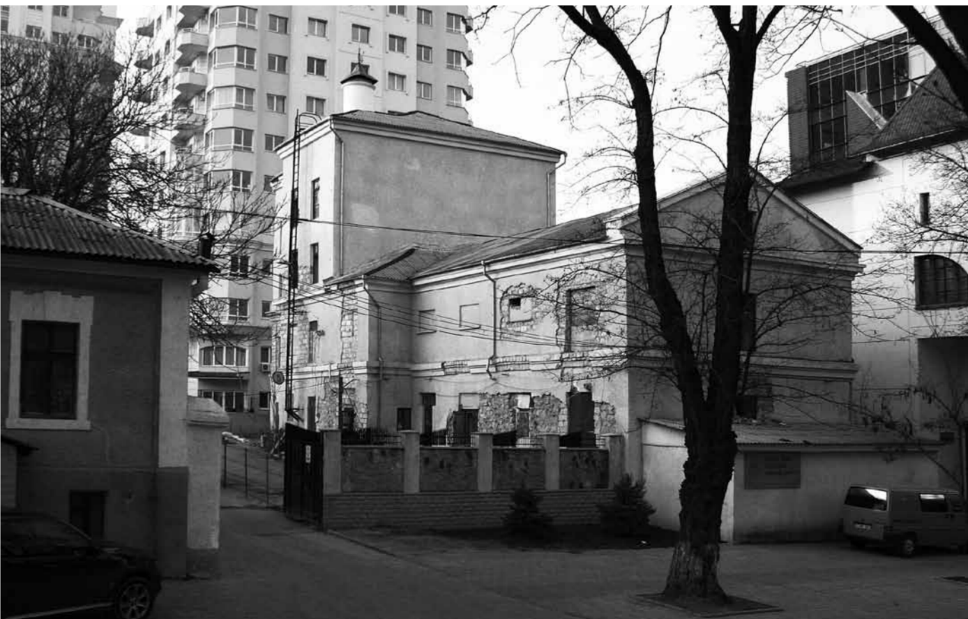
Complexul de clădiri ale fostei fabrici de bere “Bohemia”, Chișinău, 2009

If we talk about the initiatives related to an alternative culture in Chisinau, it seems like history repeats itself periodically. Once the Cuibul / Black Elephant era has gone, a new image has arisen that seems to lead to the idea trends and the whole subculture thing have changed, in both form and position. That hive in which a voice sounded agitated and nervous like it was about to make the streets descend into madness, louder than the vuvuzelas in South Africa, has perished, and the youngsters in Chisinau were suddenly becoming at the same time very colorful and yet very quiet, completely resigned to the idea of any resistance to a so-called mainstream culture. However, we all hear lately increasingly more news from the “underground” - various initiatives, events, practices, new places are being recommended to us for “being underground,” so that the phenomenon appears to be “true” and to deserve indeed our attention. We may thus wonder if underground in Chisinau really means some lively\independent cultural trends, a camouflage for the retarded markets of