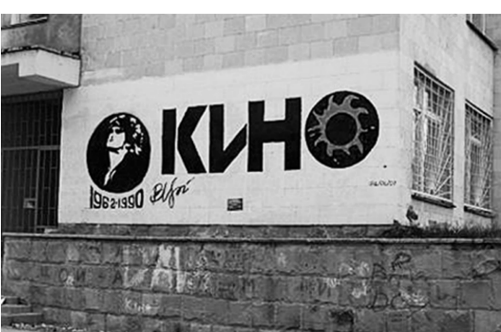
Peretele lui Viktor ȚOI, Chișinău, 2007