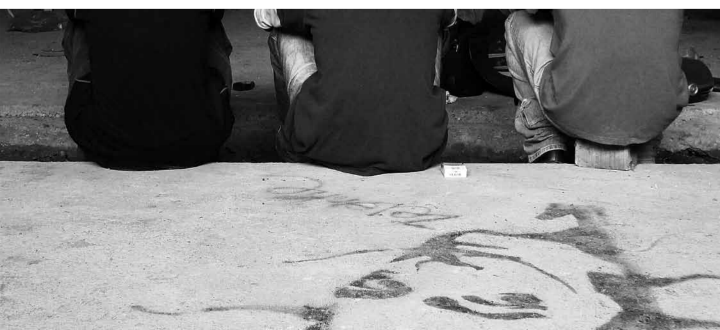
Tineri, Chișinău, 2010, foto: Vadim ȚIGANAȘ

de Merzbow, Ryoji Ikeda sau Aube sau genul breakcore (o formă evoluată de jungle-drum’n’bass), al unor Xanopticon, Venetian Snares sau Bong Ra. Muzicienii autohtoni urmează să se adapteze la aceste tendințe inovatoare și să-și dezvolte în continuare abilitățile muzicale, fiindcă, fără nici o îndoială, publicul are nevoie de ei.