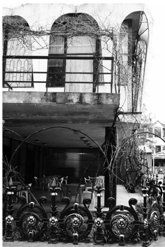
Cafeneaua GUGUȚĂ, Chișinău, 2009, foto: Vladimir US

>>> continuation on: http://plic.oberliht.com