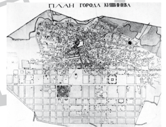
Primul plan general al orașului, semnat în anul 1834 de către guvernatorul Fiodorov