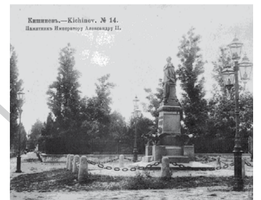
Monumentul țarului Alexandru al II-lea Eliberatorul, Grădina Publică din Chișinău (arhitect Opekushin).