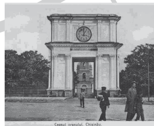
Arcul de triumf cu ceas. Imagine de epocă.